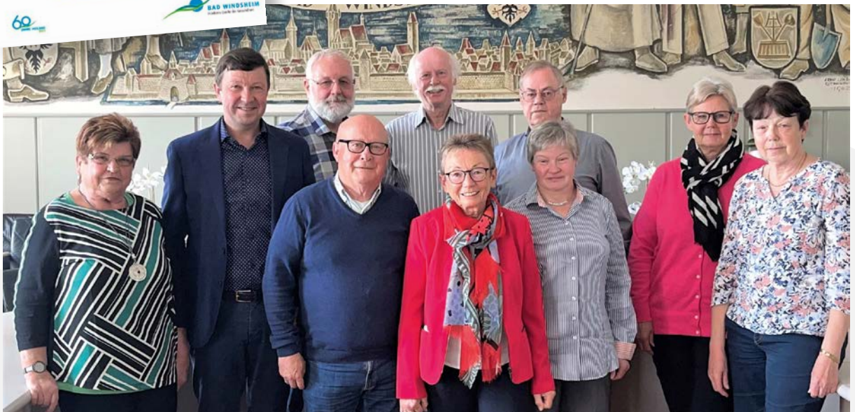
Die Vorstandschaft des Seniorenrates mit dem Ersten Bürgermeister Jürgen Heckel (2. v. l.).

Die Broschüre enthält viele Anregungen, wichtige Informationen und nützliche Tipps rund um das Älterwerden in Bad Windsheim und Umgebung. Schauen Sie doch mal rein!