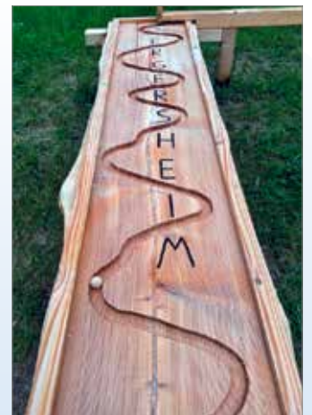
Eine kugelige, spannende Reise: In der Bad Windsheimer Gräf rollen die Holzkugeln an Häusern und dem Rathaus vorbei ...