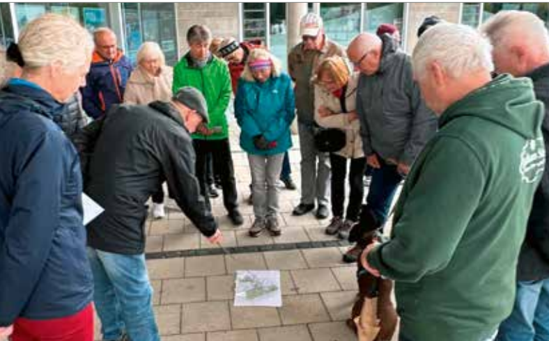
Interessierte Bürgerinnen und Bürger bei einer Geländeführung im September 2024.

Das Landschaftsarchitektur-Büro gdla aus Heidelberg plant derzeit die temporären Ausstellungsflächen der Landesgartenschau 2027 in Bad Windsheim, bei der sich Aussteller, wie beispielsweise Vereine präsentieren können. Wichtig ist dafür das Engagement der Bürgerinnen und Bürger! Eine Gartenschau lebt davon, dass sich die Bevölkerung mit ihr und ihrem Gelände identifizieren kann und Möglichkeiten nutzt, sich konkret einzubringen. Wer die Gartenschau mitgestalten möchte, kann sich in unterschiedlicher Art beteiligen. Ob eine eigene Veranstaltung, als Gäste- und Geländeführer oder mit etwas anderem. Was erwarten Sie sich von Ihrer Landesgartenschau? Ihre Ideen, Wünsche und Vor-