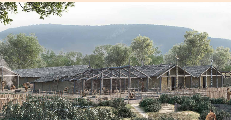
Wallmersbach, graphische Rekonstruktion der Siedlung um 5400 v. Chr.