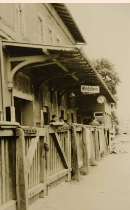
Altstadtfest 1985, Foto: Emmi Schmidt