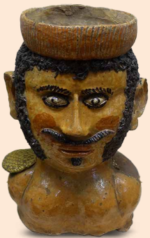
oben: Fratzentopf, Reichsstadtmuseum Bad Windsheim, Foto: Konrad Bedal unten: Spitalareal in Windsheim, 1950er Jahre, Foto: Fotostudio Heckel

DAZU LADEN WIR SIE HERZLICH EIN. DER EINTRITT IST FREI – ÜBER SPENDEN FREUEN WIR UNS.